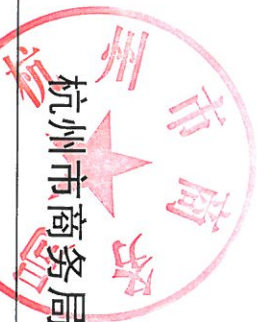
杭州市商务局 2022 年度行政处罚实施情况统计表