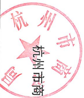
杭州市商务局 2022 年度行政强制措施实施情况统计表