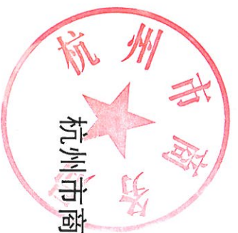
杭州市商务局 2022 年度其他行政执法行为实施情况统计表